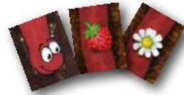
Rudy cea rosie