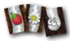
Doamna de Argint