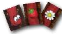
Rudy cea rosie