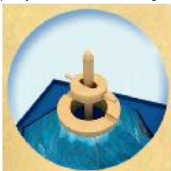
C. Plasați catargul peste inelul de lemn împreună cu piesa de susținere, astfel încât tijele acestuia să se potrivească perfect cu inelul de lemn.