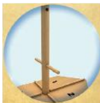
F. Introduceți o tijă prin gaura catargului.