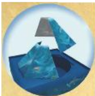
A. Îndoți cele două "valuri" și puneți-le în cutie conform imaginii de mai sus.