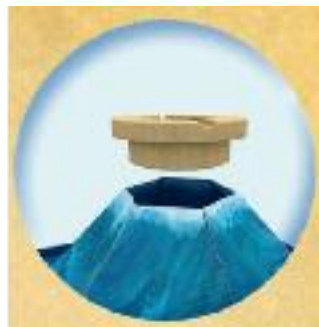
B. Plasați inelul de lemn pe gaura formată în urma unirii celor două valuri