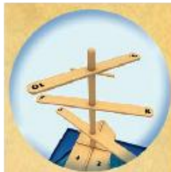
H. Repetați pașii F. și G. pentru celelalte vergi (suporturi).

Plasați tabla de joc în mijlocul mesei și începeți jocul!