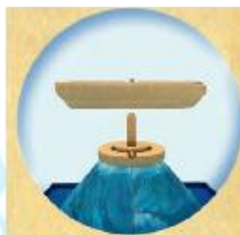
D. Așezați corabia.