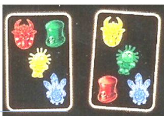
carte Voodoo de pe masa

2. In loc sa cautati cartea ce contine combinatia de ingredient si culoare ce lipseste de pe masa, puteti pune jos o carte careia ii lipseste aceeaasi combinatie. Daca puneti aceasta carte pe masa, strigati "Voodoo". Jocul se opreste imediat iar jucatorii pun cartile jos. Toti jucatorii, cu exceptia celui care a strigat "Voodoo", trebuie sa ia o carte de sub teancul de carti Voodoo de pe masa. Jucatorul aflat in stanga celui care a strigat "Voodoo" este cel care extrage primul.