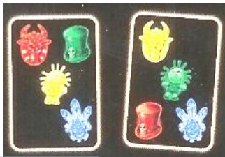
carte Voodoo de pe masa cartea lui Lea

2. In loc sa cautati cartea ce contine combinatia de ingredient si culoare ce lipseste de pe masa, puteti pune jos o carte careia ii lipseste aceeasi combinatie. Daca puneti aceasta carte pe masa, strigati "Voodoo". Jocul se opreste imediat iar jucatorii pun cartile jos. Toti jucatorii, cu exceptia celui care a strigat "Voodoo", trebuie sa ia o carte de sub teancul de carti Voodoo de pe masa. Jucatorul aflat in stanga celui care a strigat "Voodoo" este cel care extrage primul.